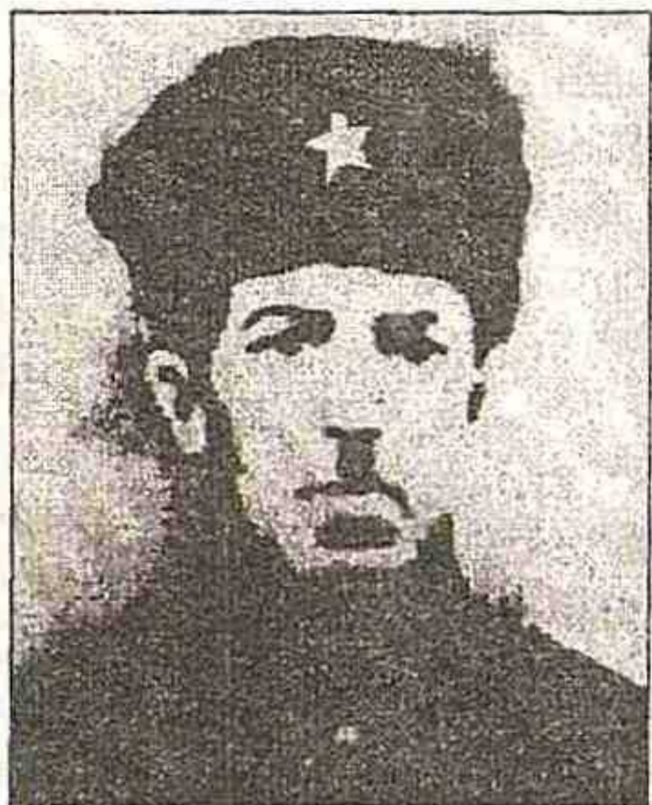
Abbasqulu bəy Şadlinski

Abbasqulu bəy Xanbaba oğlu Şadlinskinin adı xalqımızın mərd oğulları sırasında böyük hörmətlə çəkilir.