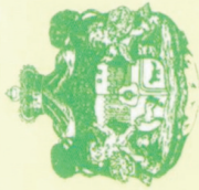
Xanlığın bayrağı və gerbi