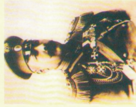
Hüseyin xan Naxçıvanski