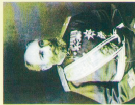
II Kalbali xan