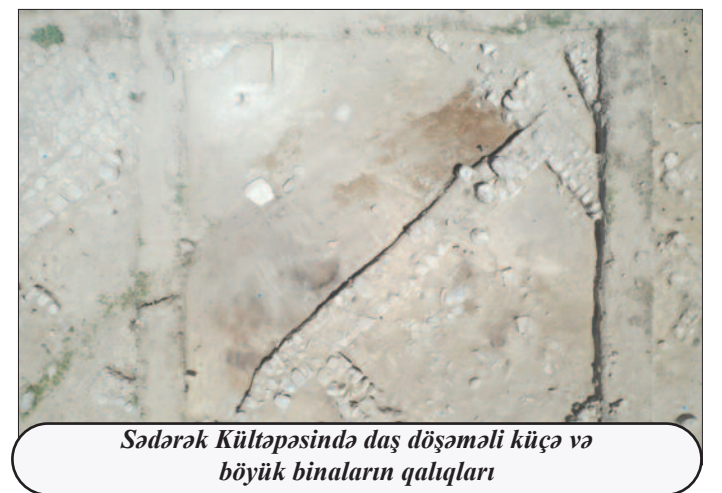
Sədərək Kültəpəsində daş döşəməli küçə və böyük binaların qalıqları

nələri, insanların təsərrüfat həyatını əks etdirən maddi mədəniyyət qalıqları aşkar olunmuşdur. Məlum olduğu kimi, Naxçıvanda şəhərtipli yaşayış yerləri eramızdan əvvəl III minilliyin sonunda meydana çıxmışdır. Tapıntılar sübut edir ki, bu əhəng Dəmir dövründə də davam etmişdir. Sədərək Kültəpəsi Cənubi Qafqazda, o cümlədən Azərbaycanın Dəmir dövrünə aid ən qədim şəhər yeridir. Arxeoloji araşdırmalar zamanı bu şəhərin yalnız bir qisminin – 600 kvadratmetrlik sahəsinin qalıqları aşkar olunmuşdur. 2019-cu ildən aparılan tədqiqatlar