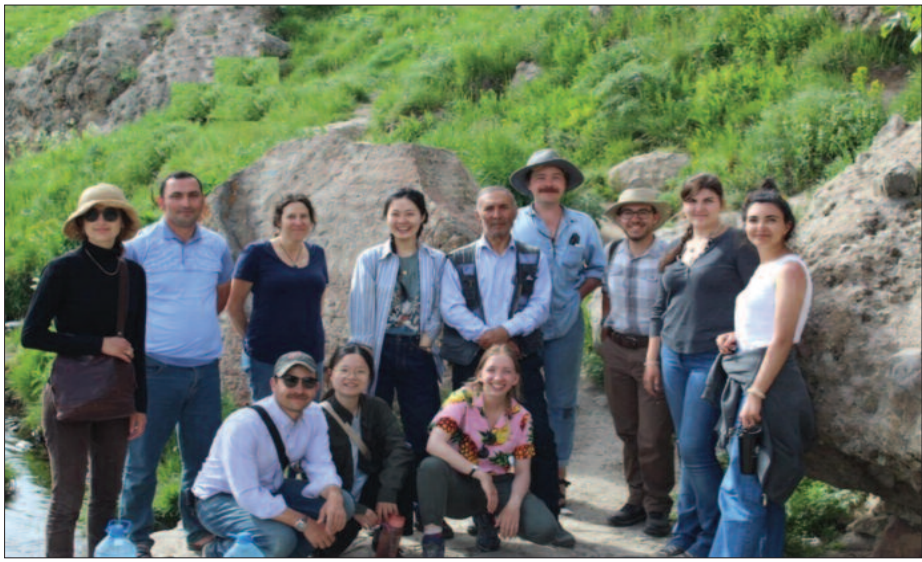
Beynəlxalq Azərbaycan-Amerika Birləşmiş Ştatlari arxeoloji ekspedisiyasının üzvləri

XXI əsrdə Azərbaycan Respublikasının ikinci dəfə müstəqillik qazanması ölkəmizin sosial-iqtisadi və mədəni inkişafında mühüm mərhələnin başlanğıcını qoydu. Bu sürətli inkişafda tarix və mədəniyyət abidələrimizin araşdırılmasına dövlət qayğısının gündən-günə artmasının da şahidi olurduq. Naxçıvan Muxtar Respublikası Ali Məclisinin Sədri cənab Vasif Talibovun tövsiyəsi əsasında Azərbaycan Milli Elmlər Akademiyası Naxçıvan Bölməsi və dünyanın müxtəlif ölkələrinin universitetləri arasında elmi əlaqələr yaradılmışdır.