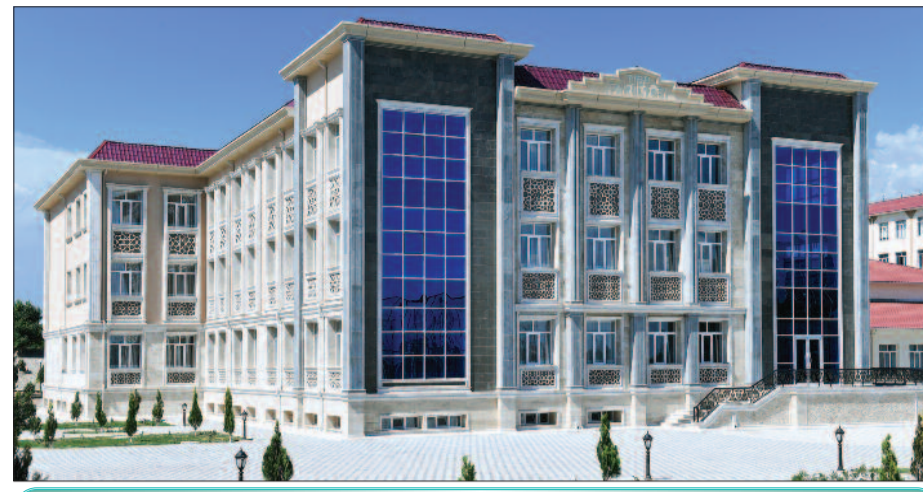
Təhsil millətin gələcəyidir