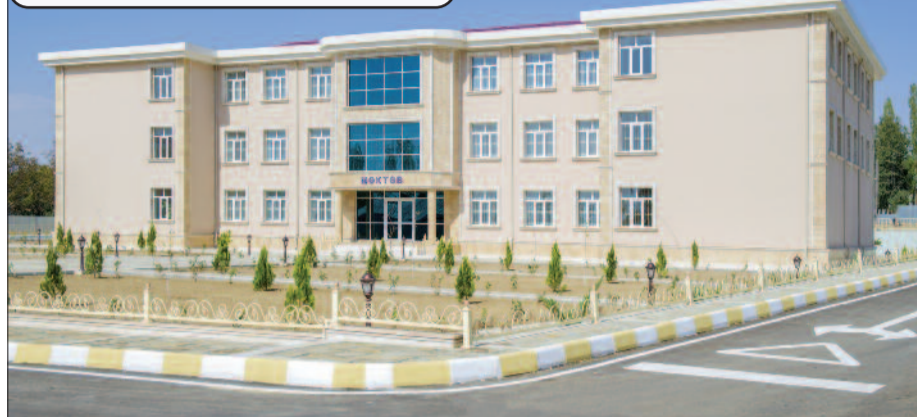
Məzrə kənd tam orta məktəbi bu gün

təhsildə də quruculuğun kompleks şəkildə reallaşdırılmasıdır. Belə ki, görülmə işlər təkcə bina tikintisi ilə yekunlaşmayıb, ən yeni avadanlıqların tədris prosesinə cəlbini də