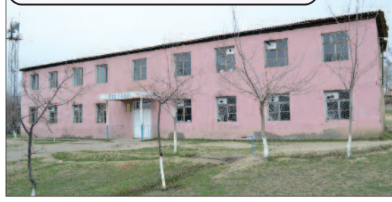
Məzrə kənd tam orta məktəbi dünən

ki, müəllimlər zəhmətkeş balalarının təlim-tərbiyəsinə qayğı ilə yanaşırlar... ...Sinif otaqlarına baxdıqca adamın ürəyi