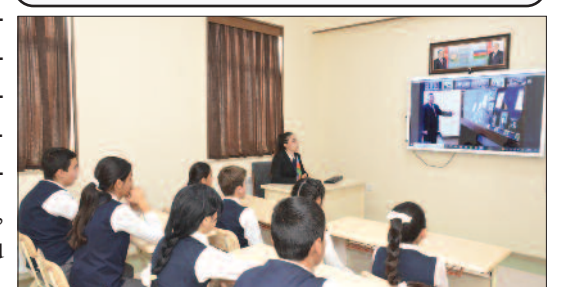
Babək rayonu, Araz kənd ümumi orta məktəbi

xidmət olub ", – deyən ulu öndər Heydər Əliyevin dövlətçiliyimizin ən ağır günlərində göstərdiyi qətiyyət bu sözlərdəki gerçəkliyi dəfələrlə təsdiqləyib.