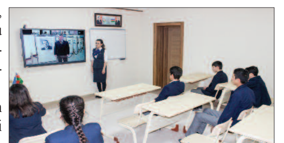
Ordubad rayonu, Dürüs kənd tam orta məktəbi

Qeyd olunub ki, ulu öndərin 1993-cü ilin iyununda siyasi hakimiyyətdən yenidən ayrıldıqdan sonra Azərbaycanda əldə edilmiş milli birlik xalqımızın ən qiymətli mənəvi-ideoloji sərvətinə çevrilib. Bugünkü güclü, qüdrətli Azərbaycanı O, öz əlləri ilə qurub-yaradıb, inkişaf etdirib, bütün dünyaya tanıdıb. Ulu öndər ölkəmizin siyasi, sosial-iqtisadi inkişaf konsepsiyalarını işləyib hazırlayıb və reallaşdırılmasını təmin edib. Ona görə də xalqımız ümummilli lideri ilə fəxr edir, qürur duyur, Onun ideyalarını həyata keçirməyə çalışır. "Mənim həyat əməlim bütün varlığım qədər sevdiyim Azərbaycan xalqına, dövlətçiliyimizə, ölkəmizin iqtisadi-siyasi, mənəvi inkişafına