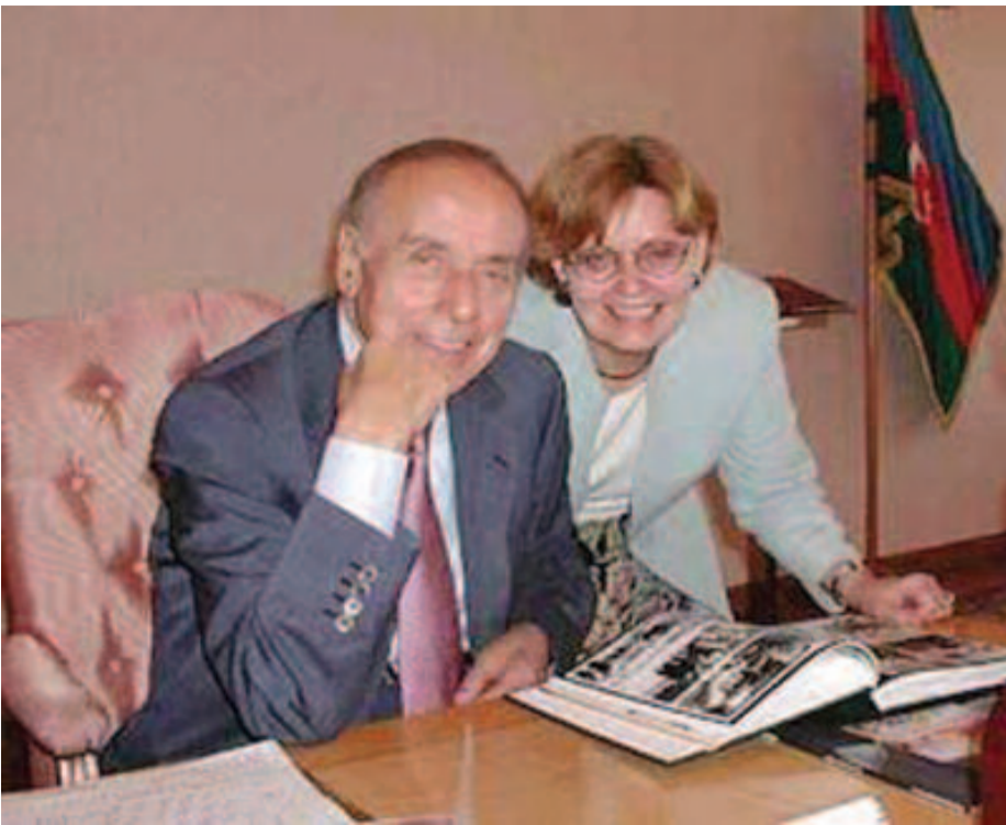
“Azerbaijan International” jurnalının baş redaktoru Betti Bleyerin 5 dekabr 1999-cu ildə – istirahət günündə iş başında olan Heydər Əliyevdən aldığı müsahibə həmin jurnalın 1999-cu ilin (7.4) sayında ingilis dilində oxuculara təqdim edilib. İngiliscədən Azərbaycan dilinə tərcümə edilən müsahibənin aktuallığını nəzərə alaraq oxuculara təqdim edirik.

Betti Bleyer: – Mən sizdən əksər jurnalistlərin ən son siyasi və regional hadisələr haqqında soruşduğu ənənəvi sualları deyil, daha çox şəxsi həyatınız, tərbiyə, bu əsrin yarısından çoxunda rəhbərlik etdiyiniz xalqınız haqqında soruşmaq istərdim.