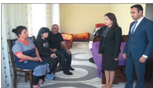
Naxçıvanda 15 may – Beynəlxalq Ailə Günü ilə əlaqədar Naxçıvan

şəhər Qaracux kəndində və Şərur rayonunun Axura kəndində yaşayan sağlamlıq imkanları məhdud üzvlü olan və çoxuşaqlı aztəminatlı ailələrə baş çəkilib.