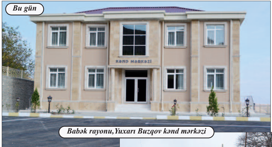
Babək rayonu, Yuxarı Buzqov kənd mərkəzi

Muxtar respublikamızın kəndlərində quruculuq tədbirlərinə start verilmədən öncə bekarlıq əlamətləri, zərərli vərdişlər aşılardan, insanları həm bioloji, həm də psixoloji marazə yoluxdurən naqisliklərin aradan qaldırılması qarşıya məqsəd qoyuldu. Belə ki, yaşayış məntəqələrində antisanitariya ünvanları funksiyasını