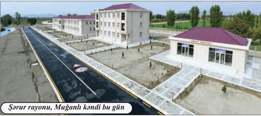
Şərur rayonu, Muğanlı kəndi bu gün

üstün cəhətlərin nəticəsidir ki, əgər 1995-ci ildə 25476,6 hektar ərazi əkilirdisə, 2020-ci ildə 63405 hektar sahədə əkin aparılıb, ümumilikdə, kənd təsərrüfatı məhsulu 1995-ci illə müqayisədə 13,9 dəfə artaraq 537 milyon 584 min 800 manat olub.