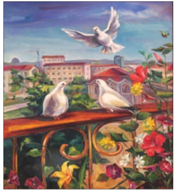
Həbibə Allahverdiyeva: "Çiçəkli eyvan"