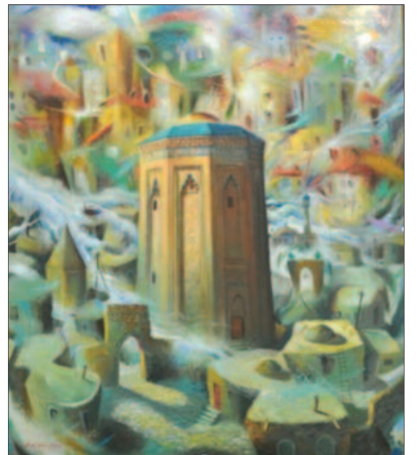
Həsən Qurbanov: "Naxçıvan-95"