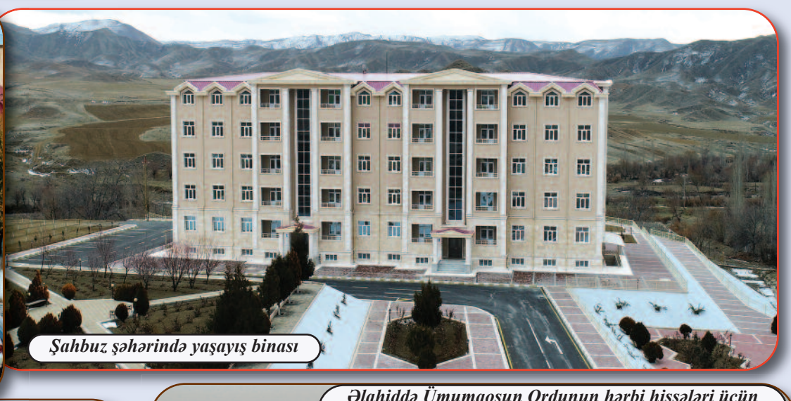
Şahbuz şəhərində yaşayış binası