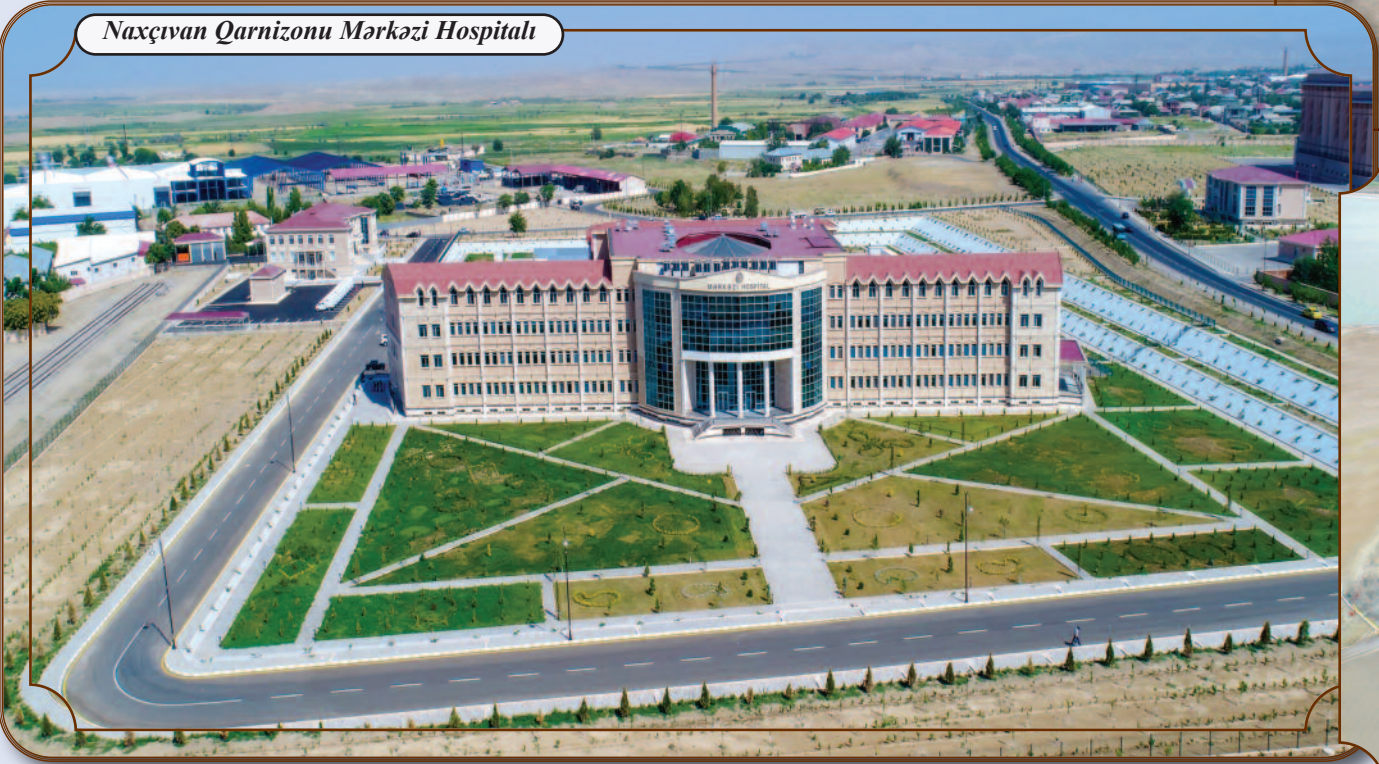
Naxçıvan Qarnizonu Mərkəzi Hospitalı