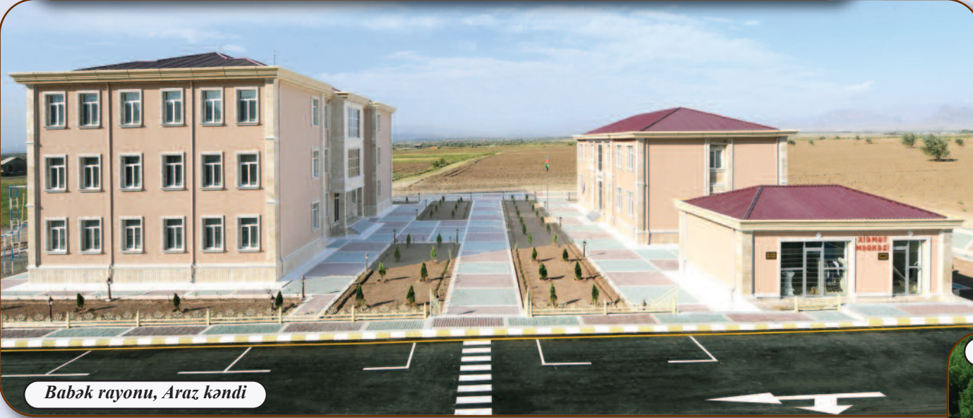
Babək rayonu, Araz kəndi