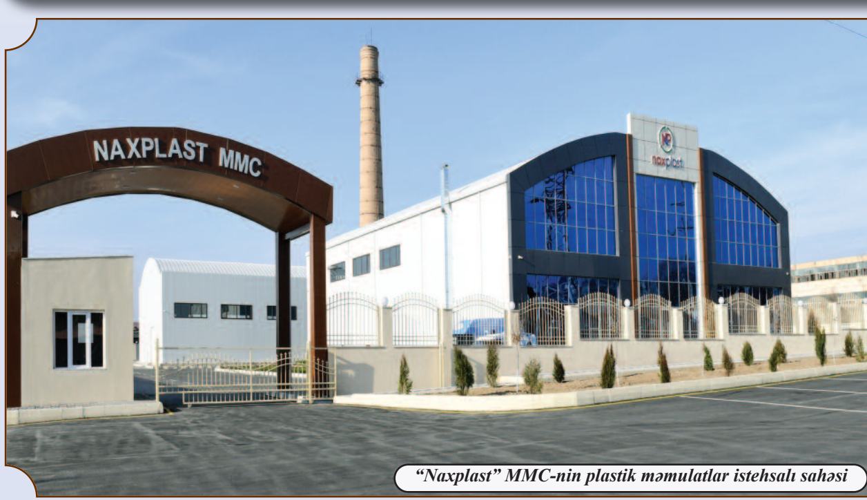
“Naxplast” MMC-nin plastik məmulatlar istehsalı sahəsi