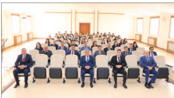
Naxçıvan Dövlət Texniki Kollecinin rəsmi internet saytının təqdimatı keçirilib.

Naxçıvan Muxtar Respublikasının Əməkdar jurnalisti