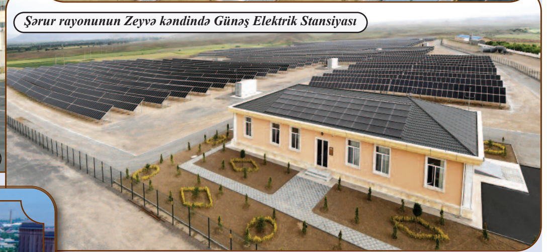
Şərur rayonunun Zeyvə kəndində Günəş Elektrik Stansiyası