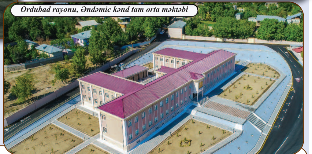
Ordubad rayonu, Əndəmic kənd tam orta məktəbi