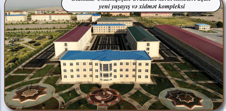
Əlahiddə Ümumqoşun Ordunun hərbi hissələri üçün yeni yaşayış və xidmət kompleksi