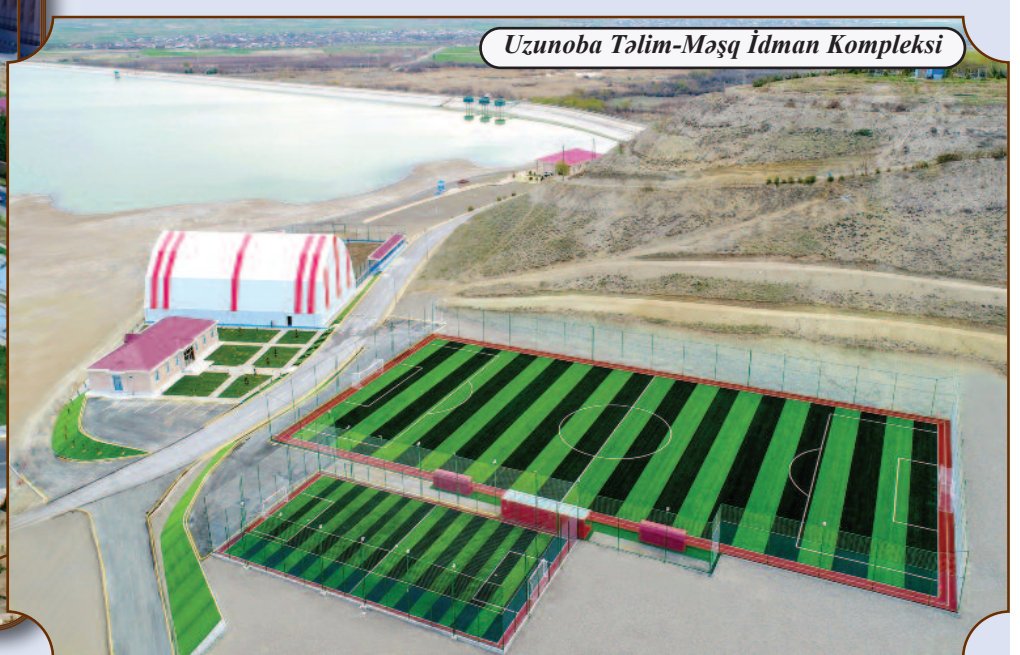
Uzunoba Təlim-Məşq İdman Kompleksi