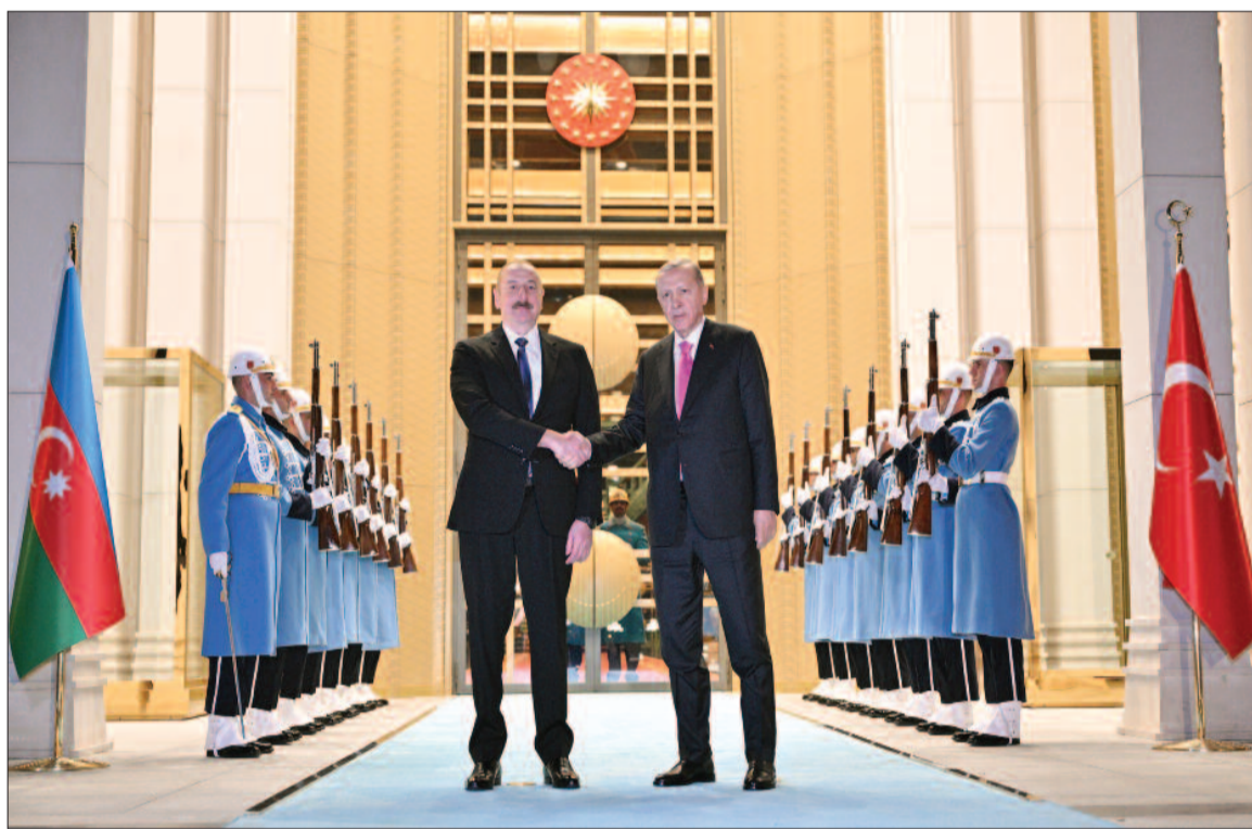
Rəcəb Tayyib Ərdoğan Türkiyədə baş verən dəhşətli zəlzələdən dərhal sonra ölkəmizin göstərdiyi qardaşlıq dəstəyini və nümayiş

Türk Dövlətləri Təşkilatının bu formatda keçirilən sammitlərinin əhəmiyyəti qeyd edildi, Zirvə görüşünün Türkiyədə baş vermiş zəlzələnin nəticələrinin aradan qaldırılması mövzusunda həsr olunmasının önəmi vurğulandı.