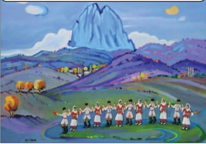
"Dağlar qoynunda yallı", rəssamı Əli Səfərli