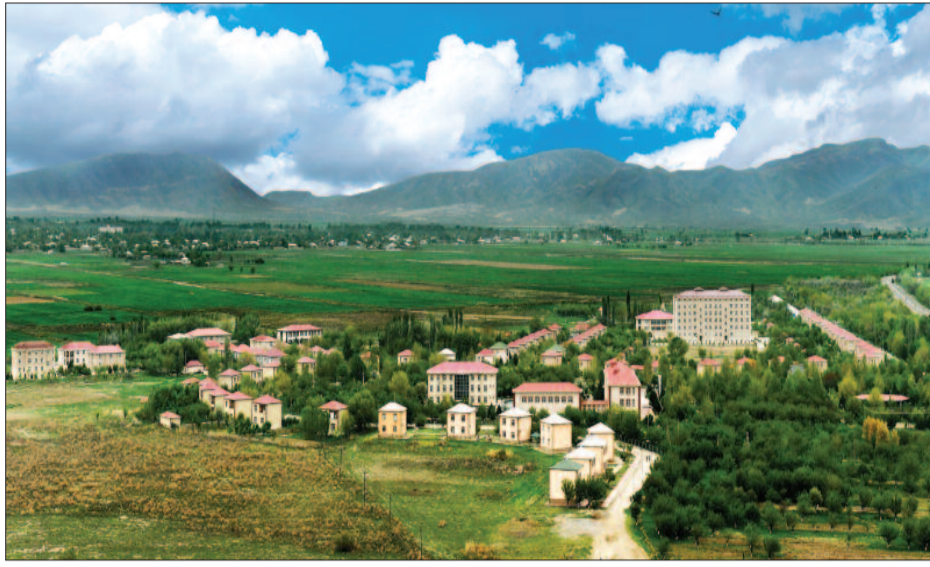
Inkişaf edən bölgələrimiz

Sədərək rayonunun mərkəzi olan Heydərabad qəsəbəsində illər əvvəl, hələ sovetlər dönəmində dahi rəhbərin istəyi ilə mənzillər inşa edilmiş və sakinlərin burada məskunlaşmasına şərait yaradılmışdır. Uzaqgörən rəhbərin adını daşıyan qəsəbə 90-cı illərin əvvəllərində mənfur düşmənin hücumları zamanı tamamilə dağılmış, amma insanlar öz mətanətini qorumuş və düşmənin hücumlarının qarşısını almışdır. Həmin günlərdə insanların bir çoxunun evinə mərmilərlə düşüb əzizlərini qanına qəltan etsə də, səngərdə döyüşlərin cəsarətini qıra bilmədi. Həmin günlər ölkəmizin hər kəndindən, şəhərdən oğullar axışdı Sədərəyə, bu torpağı müdafiə etdilər, can qurban verdilər Vətən dediyimiz bir ovuc torpağa. Kimi canından, kimisi sağlamlığından keçdi, amma bir ovuc torpaqdan keçmədik. “Vətəndən pay olmaz”, – dedik. Dahi rəhbərin qayıdışı insanlara güc verdi. Ulu öndər Heydər Əliyevin onu canı qədər sevən, ona özü kimi inanan insanların qarşısında: “Mən doğma torpağuma, Naxçıvana, Naxçıvan Muxtar Respublikasına hədsiz məhəbbətimi bir daha bil-