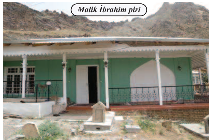
Malik İbrahim piri

Xanağa piri Ordubad rayonunun Xanağa kəndində ziyarətgahdır. Kəndin şərq tərəfində yerləşən, ikiotaqlı binadan ibarət pirin içərisində qara örtük çəkilmiş bir qəbir vardır. Üzərində kitabə olmadığından qəbrin kimə məxsusluğu müəyyənləşdirilməyib. Lakin rus alimi V.M.Sisoyev 1926-cı ildə pirin böyük otağında bir-birindən 20 santimetr aralı iki qəbir olduğu barədə məlumat verərək bildirib ki, pirin cənub divarındakı pəncərənin sağ və sol tərəfində Ordubad ərazisi üçün səciyyəvi olan yaşılımtıl daşdan baş daşları qoyulub. Sağ tərəfdəki başdaşı üzərindəki ərəbcə kitabədə Quran ayəsi, mərhumun adı və vəfat tarixi həkk olunub: "Bu qəbir Seyyid Həmidin oğlu mərhum Seyyid Tahirindir. Yeddi yüz yeddi tarixdə" (1308). Sol tərəfdəki başdaşının üzərindəki 7 sətirlik kitabədə onun Şeyx Nurrəddinin oğlu Şeyx İslamın qəbri olduğu göstərilir. Baş daşlarından məlum olur ki, üstü hörlülüb suvararaq tək şəkllə salınmış qəbir, əslində, vaxtilə iki qəbirdən ibarət olub. Bu pirin yerində vaxtilə hansısa