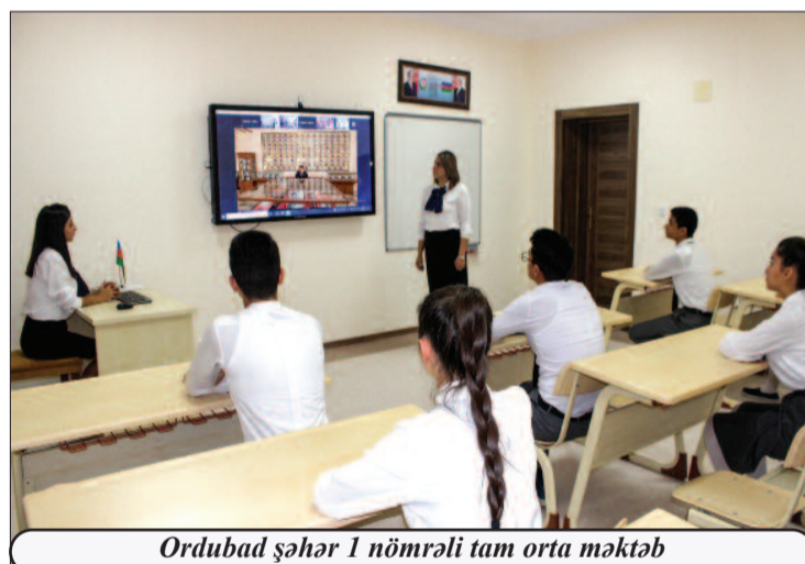
Ordubad şəhər 1 nömrəli tam orta məktəb

Şagirdlərə məlumat verilib ki, döyüşlərdə Azərbaycan daha az