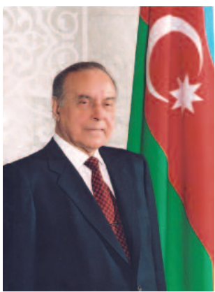
Doğma, canım-varlığım qədər sevdiyim Azərbaycanım mənim qibləgahımdır