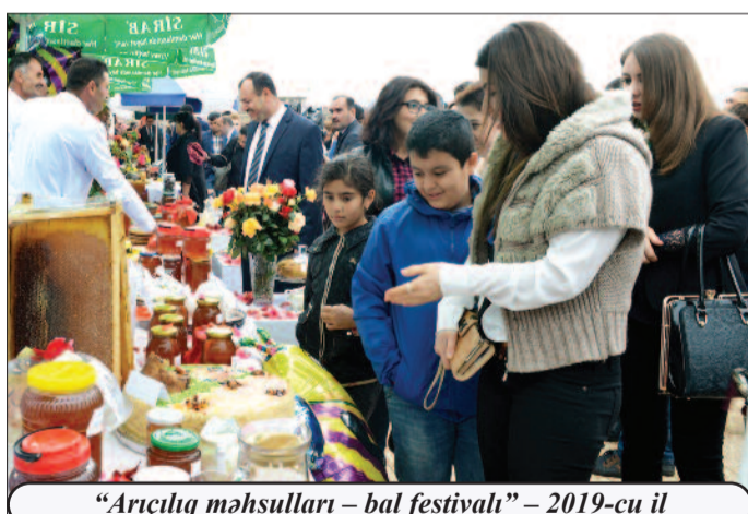
“Arıçılıq məhsulları – bal festivalı” – 2019-cu il

landırılmasından biridir. Muxtar respublikada arıçılığın tarixi kökləri və ənənələrinin olması yerli arı genofondunun formalaşmasına şərait yaratmışdır. Məhz dövlət proqramında nəzərdə tutulan tapşırıqlardan biri yerli arı genofondunun mühafizəsindən ibarətdir. Bu məqsədlə ötən dövrdə yerli arı cinsi olan “Sarı Qafqaz”ın Naxçıvan populyasiyasının qorunub